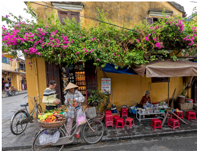
Frugt og grønt i Hoi An

I bliver hentet fra hotellet kl. 08:30 og kører mod Mekong Deltaet. Et utroligt smukt område hvor floder og kanaler skaber en labyrint af øer hvor små både sejler ud og ind mellem hinanden, her bliver handlet mellem bådene i et kæmpe flydende marked. Ved flodbreden venter en motorbåd der sejler jer til Mekong Lodge hvor der serveres frokost. Herefter tur på cykel til Tan Phong Øen ialt en tur