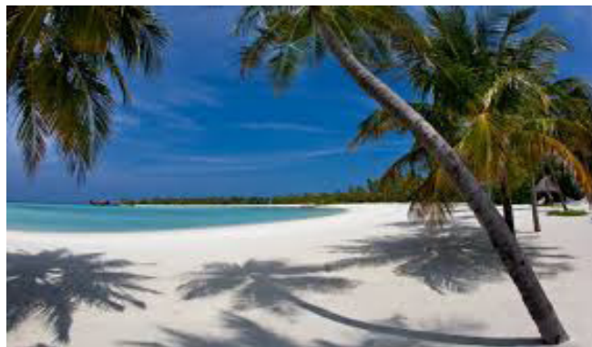
Mui Ne stranden

Ankomst til Hanoi klokken 4:15 og derfra transport til Boutique 1 hotel for at spise morgenmad, tage et bad og slappe lidt af inden turen går mod Halong bay. I bliver hentet ved 8 tiden og køre ca 3 timer til Halong Bay, hvor vi går ombord på Tonkin cruise boat. Der serveres frokost under sejladserne. Her kan I nyde de smukke limsten