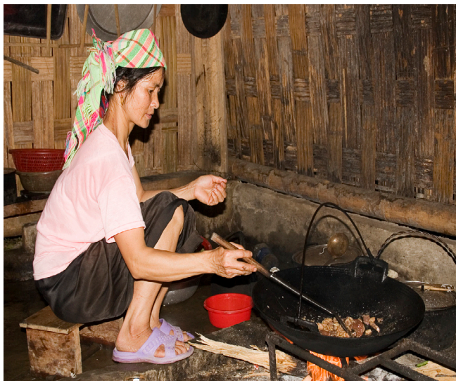
Lokal madlavning i Sapa

Ankomst til København kl. 07:05 og slut på tur